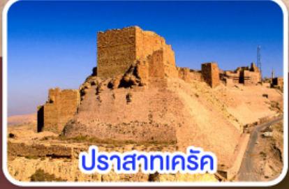
ปราสาทครีค