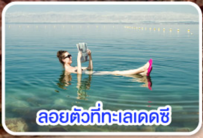
ลอยตัวที่ทะเลเดดซี