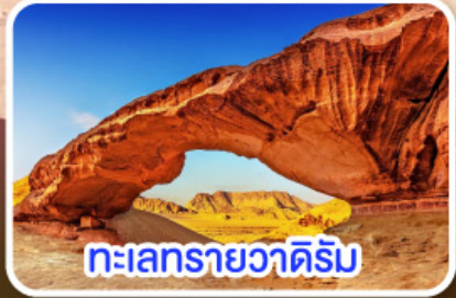
ทะเลทรายวาดีรัม