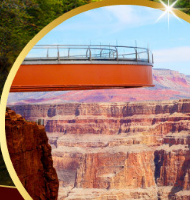
แกรนด์แคนยอน Sky walk