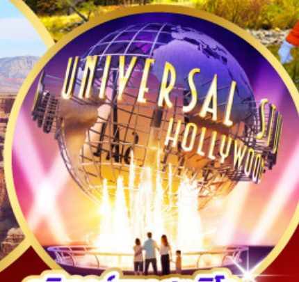
ยูนิเวอร์แซลสตูดิโอ