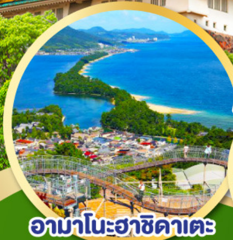
อามาโนะฮาซิดาเตะ