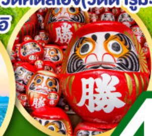
วัดคิตสึโอจิ(วัดคารุมะ)