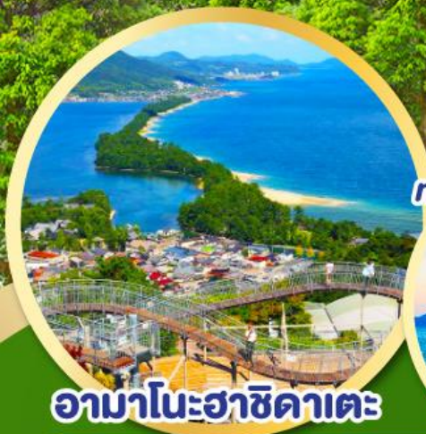
อามาโนะฮาซิดาเตะ