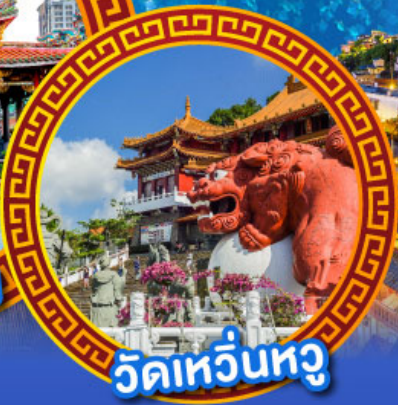
วัดเหวียนหู่