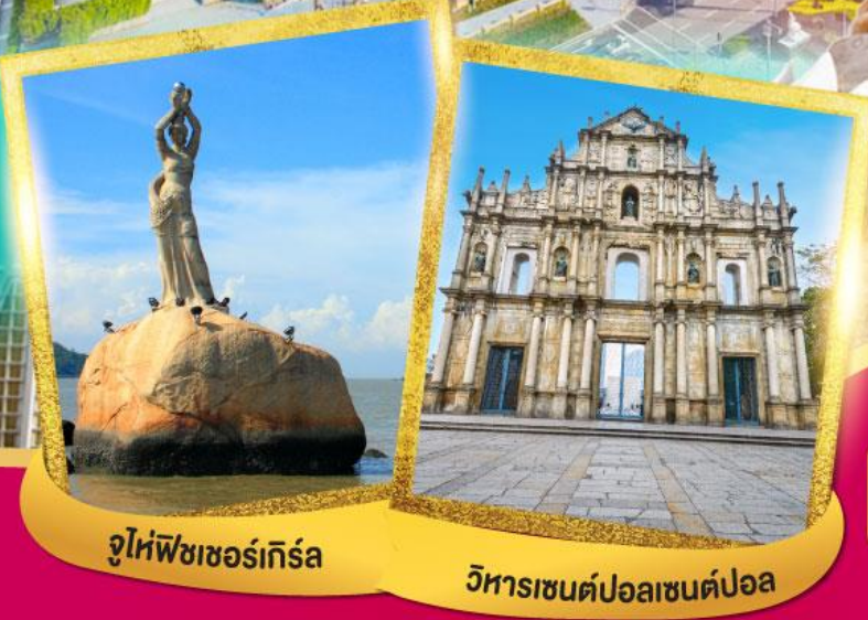
จูไห่พีชเชอร์เกิร์ล