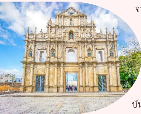
แห่งเดียวเท่านั้นในโลก

หมายเหตุ: เนื่องจาก เจ้าแม่กวนอิมริมทะเล อยู่ระหว่างการซ่อมบำรุง ตั้งแต่ตอนนี้จนถึงเดือน เมษายน 2567 กรุณ ัณ วันที่เดินทางยังซ่อมบำรุงไม่เรียบร้อย ทางบริษัทของสงวนสิทธิ์ ในการนำท่านเดินทางสู่ ไทปาสตรีทฟู้ด ถนนที่เต็มไปด้วยร้านอาหาร ขนม ของอร่อยเมืองมาเก๊า ทดแทน