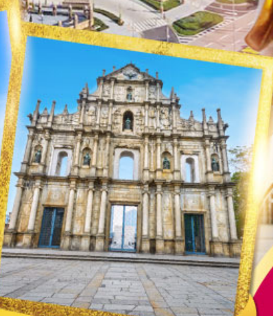
วิหารเซนต์ดอมินิค