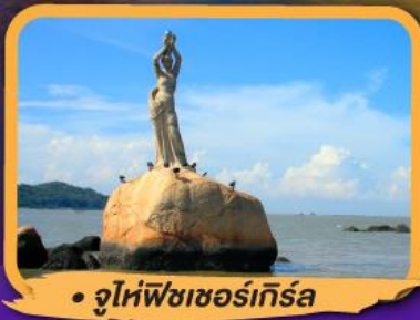
• จูไห่ฟิชเชอร์เทิร์ล