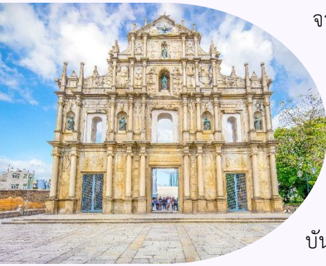
แห่งเดียวเท่านั้นในโลก

จากนั้นนำท่านชม วิหารเซนต์ปอล (Ruins of St. Paul's) โบสถ์แห่งนี้เคยเป็นส่วนหนึ่งของวิทยาลัยเซนต์ปอล ซึ่งก่อตั้งในปี ค.ศ. 1594 และปิดไปในปี ค.ศ. 1762 และเป็นมหาวิทยาลัยตามแบบตะวันตกแห่งแรกของเอเชียตะวันออก โบสถ์เซนต์ปอลสร้างขึ้นในปี ค.ศ. 1580 แต่ถูกทำลายถึงสองครั้ง ในปี ค.ศ. 1595 และ ค.ศ. 1601 ตามลำดับ จนกระทั่งเกิดเพลิงไหม้ในปี ค.ศ. 1835 ทั้งวิทยาลัย และโบสถ์ถูกทำลายจนเหลือแต่ด้านหน้าของตึกฐานโบสถ์ส่วนใหญ่และบันไดด้านหน้าของตึกแสดงให้เห็นถึงสไตล์ผสมระหว่างตะวันออกและตะวันตกและมีอยู่ที่นี่เพียง