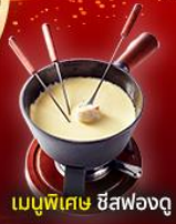
เมนูพิเศษ ชีสฟองดู

2 ยอดเขาที่สวยงามที่สุด Jungfrau และ Matterhorn รวมตั๋วรถไฟ Glacier Express และ Gornergrat train เมืองมองเทรอ ปราสาทซิลยอง เวเวย์ รูปปั้นชาร์ลี แชปลิน โลซาน ศาลาไทย เบิร์น ลูเซิร์น สะพานไม้ชาเปล ลิงโตสะอัน ทะเลสาบสิมรกต เบลาเซ