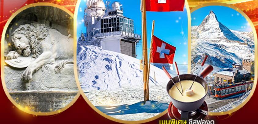
เมนูพิเศษ ชีสฟองดู

เดินทาง 20 - 27 กันยายน 67 / 9 - 16 ตุลาคม 67