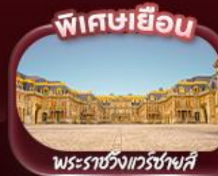
พิศขเยือน