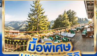
มือพิเศษ บนยอดเขารัก