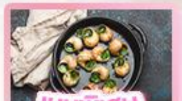
เมนูพิเศษ หอยออสตาโก้