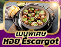
เมนูพิเศษ หอย Escargot