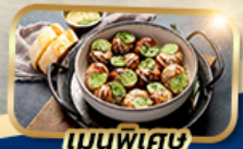
เมนูพิเศษ หอย Escargot