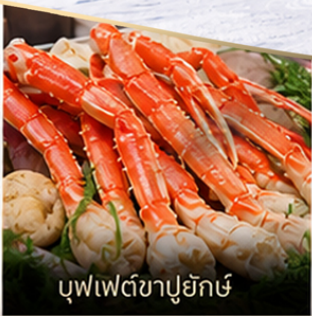
บุฟเฟ่ต์ซาปูยักซ์