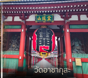
วัดอาสาซุกุสะ