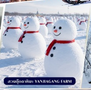
สวนตุ๊กตาหิมะ YANJIANG FARM