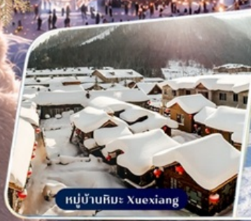
หมู่บ้านหิมะ Xuexiang