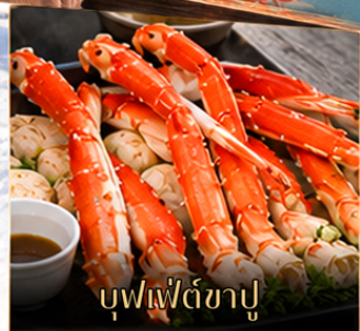
บุฟเฟ่ต์ซาชู