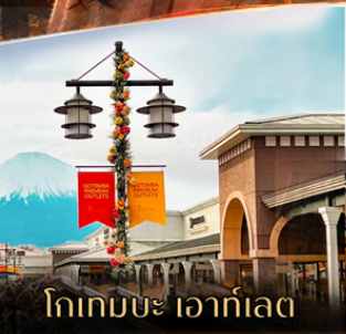
โกเกมบะ โอเอท์เลต