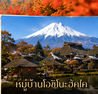
หมู่บ้านโอชิโนะฮักไค