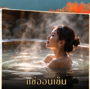
แช่ออนเซ็น