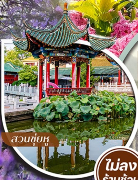
สวนชื่อยุ่