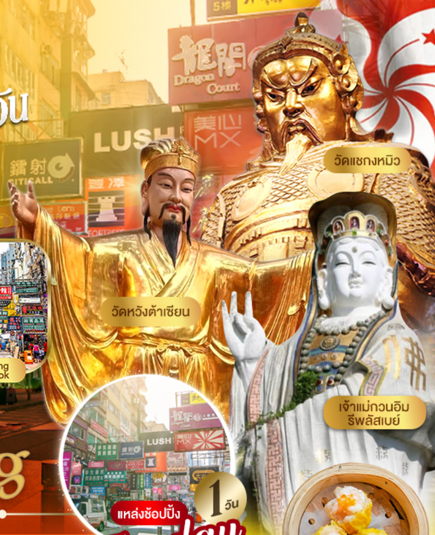
วัดเชงหมิว