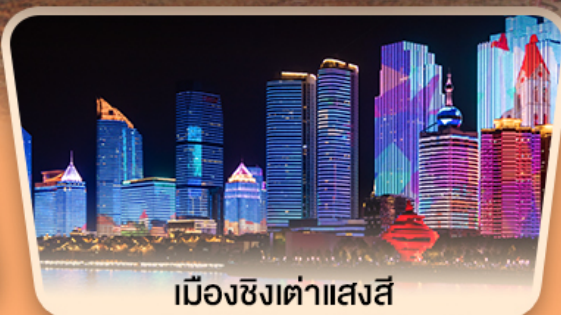
เมืองซิงต้าแสงสี