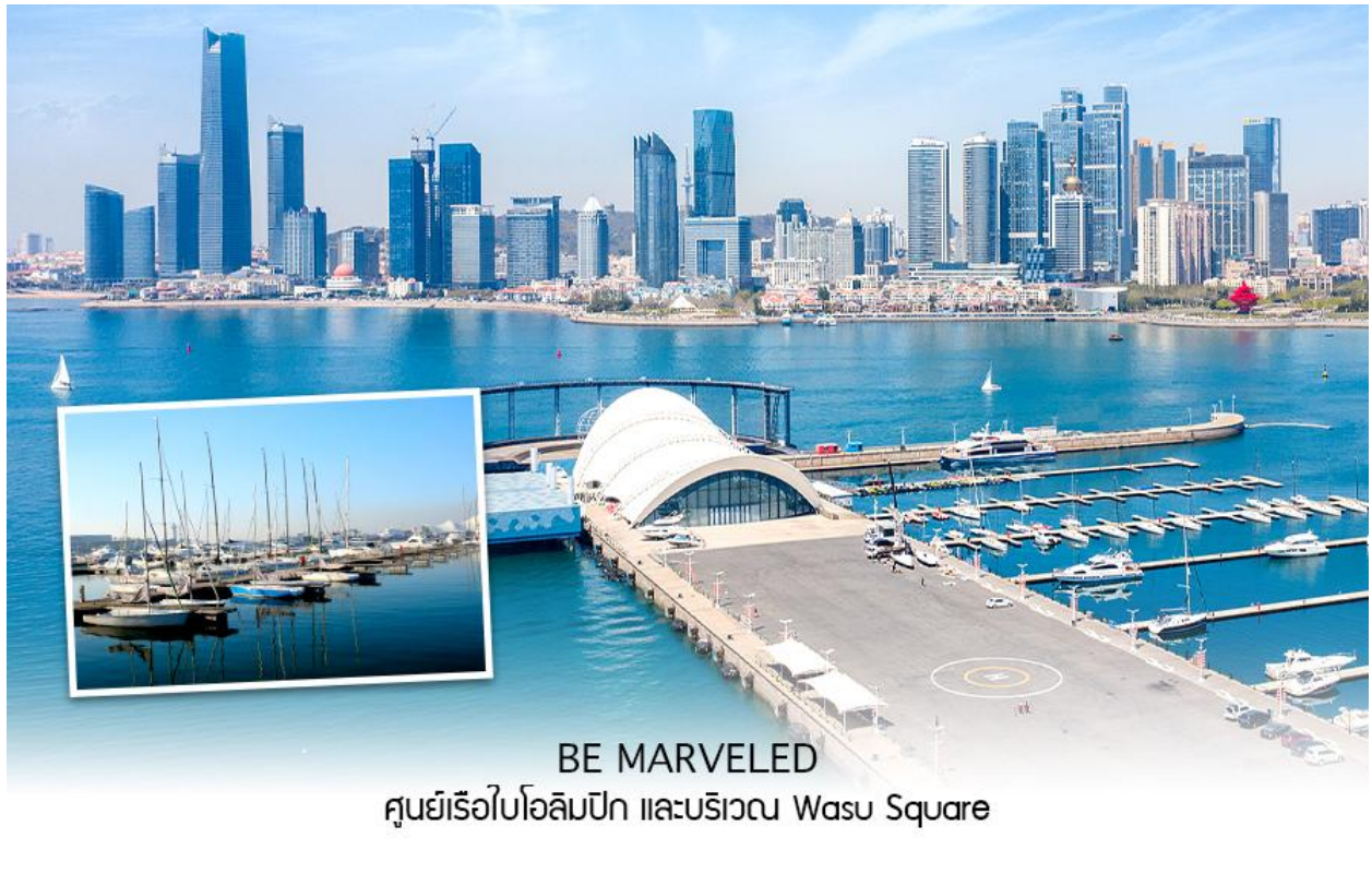
BE MARVELED ศูนย์เรือใบโอลิมปิก และบริเวณ Wasu Square

จากนั้นนำท่านไป ถนนคนเดินสไตล์เยอรมัน การผสมผสานของวัฒนธรรมจีนและเยอรมันเหมือนเดินเล่นอยู่ในยุโรป บรรยากาศดี คึกคัก โดยเฉพาะช่วงเวลากลางคืน สามารถช้อปปิ้ง ถ่ายรูปเล่นได้