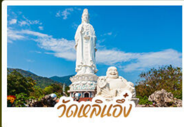
วัดเข็กเจ็ง