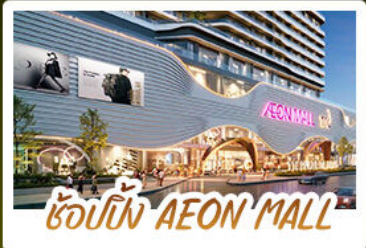
ช้อปปิ้ง AEON MALL