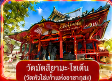
วัดมัตสึยามะ-โชเด็น (วัดหัวไข่แห่งอาซากุสะ)