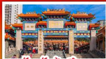
วัดเข้งต้าเซิน

วัดเจ้าแม่กวนอิมฮ่องฮำ - กระชานองปิง พระใหญ่โป่วหลิน - เจ้าแม่กวนอิมรพิลส์เบย์ วัดซำฮ่องกง, ห่านย่าง และอาหารชาบู