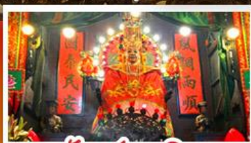
วัดซำฮ่องกง