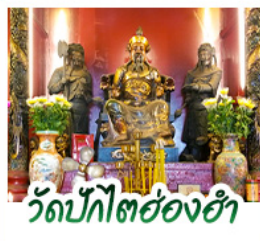
วัดปึกโตช่องชำ