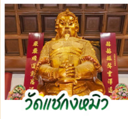
วัดเข่งหนิว