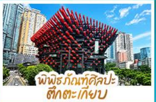
พิพิธภัณฑ์ศิลปะ ฮักกะเก๋ยบ