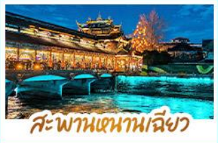
สะพานหนามเฉียว

เช็กอิน "ภูเขาสี่ครุณี" ชมทิวทัศน์ภูเขาหิมะติดกับผืนป่าสุดอลังการ ชมแสงสีสุดโรแมนติก BLUE TEARS ณ สะพานหนามเฉียว นั่งรถไฟความเร็วสูง เชื่อม 2 มหานคร เฉิงตู - ฉงชิ่ง ถ่ายภาพรถไฟกะตุ๊ก แลนด์มาร์กดังแห่งฉงชิ่ง เช็กอินจุดชมวิว LIGHT OF COPPER วิวยามค่ำคืนสุดตระการตา