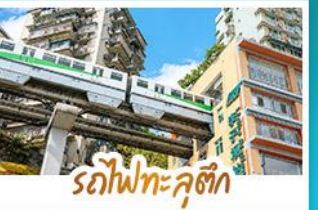
รถไฟกะตุ๊ก