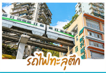
รถไฟทะเลสาบ