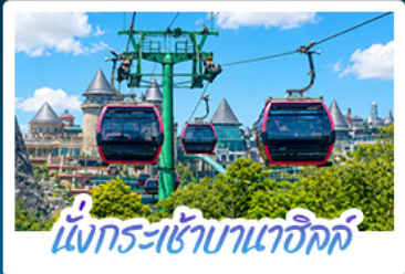
นั่งกระเช้านาฮิลล์