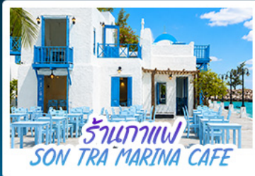
ร้านอาหาร SON TRA MARINA CAFE