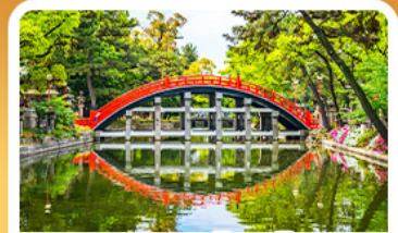
ศาลเจ้าซูมิโยชิ โกเบ