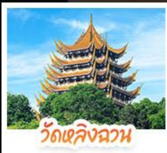
วัดเลิ่งอว่น