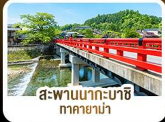
สะพานนากะบาชิจิ ทาคายาม่า