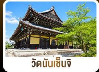
วัดนินเซ็นจิ