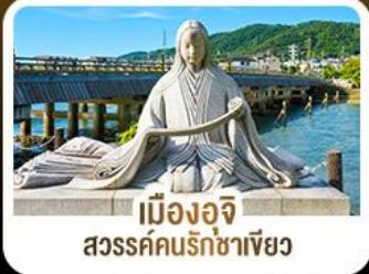
เมืองอูจิ สวรรค์คนรักชาเขียว