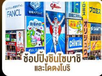
ช้อปปิ้งชินโซบาชิจิ และโดตงโบริ