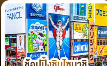
ช้อปปิ้งชินโซบาชิ และโดตงโมริ