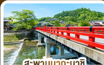
สะพานนากะบาชิ ทาดายาม่า