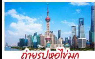
ถ่ายรูปไข่มุก