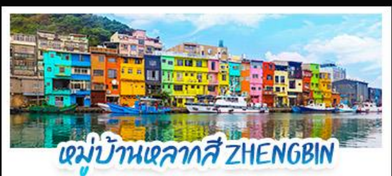
หมู่บ้านหลากสี ZHENGBIN

18 - 21 ก.ค. 69 | 12 - 15 ก.ย. 69 15 - 18 ส.ค. 69 | 28 - 31 ต.ค. 69