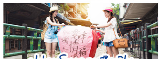
ปลั๊กอินคอมลอยซีฟีน