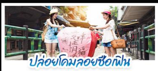
ปลอ้อคอมลอยซือเฟิน