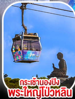
กระเช้าองปิง พระใหญ่ไผ่หลิน