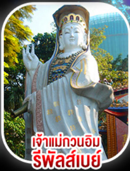
เจ้าแม่กวนอิม รีฟลัสเบีย