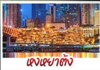
แดงเซยาดัง