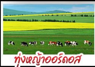
ทุ่งหญ้าเออร์ดอส

ทุ่งหญ้าเออร์ดอส สุสานเจกิสข่าน แกรนด์แคนยอนแม่น้ำเหลือง