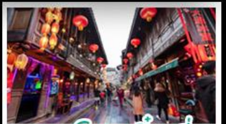
ถนนโบราณจินหลี่