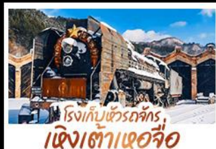
โรงเก็บข้าวรถจักร, เจิ่งเต๋าเซวี่จื่อ