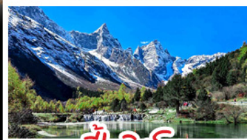
ปี่ผิงโกว