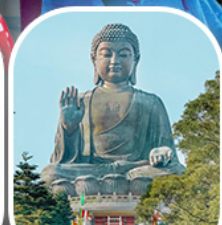
พระใหญ่โป้วหลิน