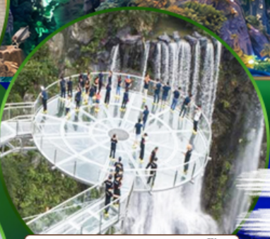
สะพานแก้วคู่หลงเซี่ยะ