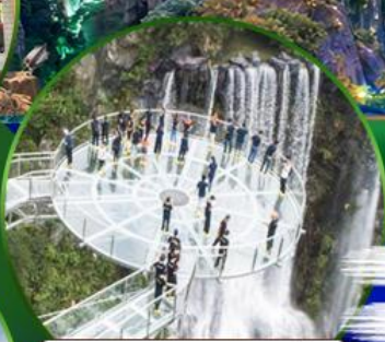
สะพานแก้วคู่หลงเซี่ยะ