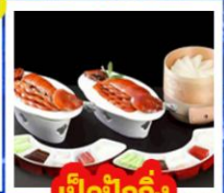
เปิดปิกกิ้ง