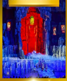
โชว์เส้นทางสายไหม