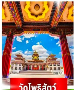
วัดโพธิ์สัตว์