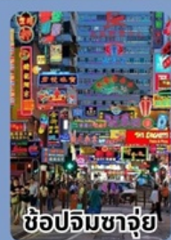
ช้อปปิ้งจตุรัส