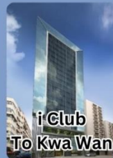
i Club To Kwa Wan