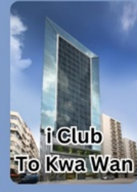
iClub To Kwa Wan

คอนเฟิร์มเดินทาง พฤศจิกายน 2567 2-4 / 9-11 / 16-18 23-25 / 30 พ.ย. - 2 ธ.ค.