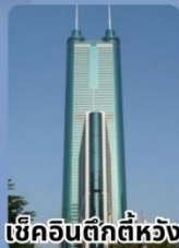
เช็กอินตึกทีห้วง