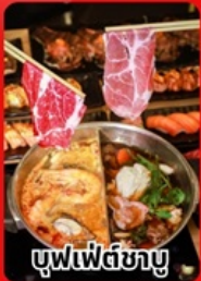
บุฟเฟ่ต์ซาบู