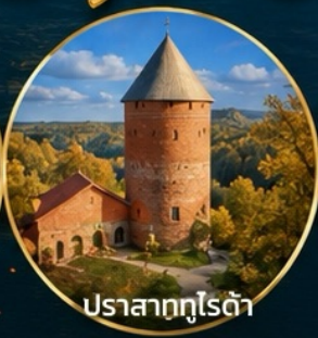
ปราสาทกูโรต้า