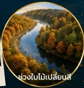
ช่วงใบไม้เปลี่ยนสี