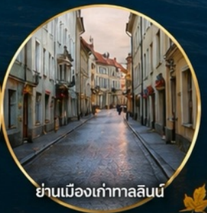
ย่านเมืองเก่าทาลลินน์