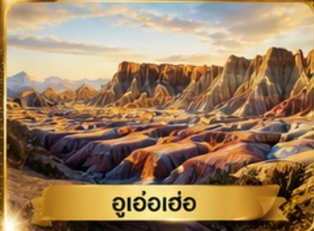
อุ่อเอ้อ