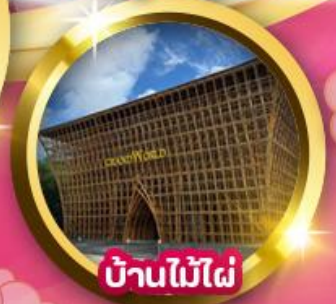
บ้านไม้ไฟ

นั่งกระเช้าลอยฟ้าที่ยาวที่สุดในโลกข้ามทะเลสีครามสู่ เกาะ Hon Thom Eagle Eye หอคอยชมวิวแบบ 360 องศา เห็นเกาะฟู้ทวีก VinWonder สนุกสุดเหวี่ยงกับเครื่องเล่นระดับสากล อควาเรียมทรงเต่ายักษ์ สุดตระการตา "เวนิสแห่งเอเชีย" Grand World Phu Quoc สถาปัตยกรรมสไตล์ยุโรปหลากสีสัน