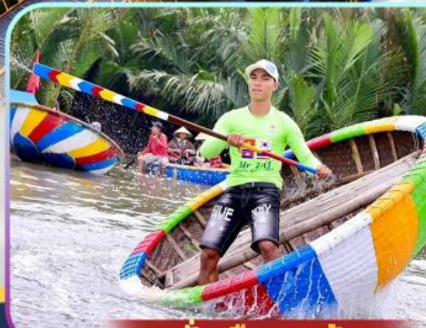
นั่งเรือกระดัง