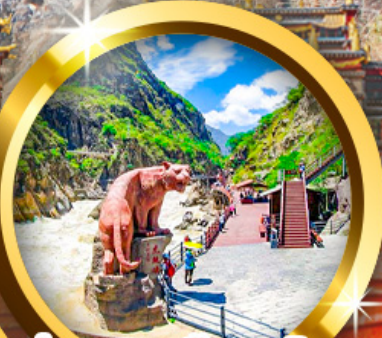
ช้างแคบเสือกระโจน