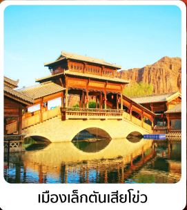
เมืองเล็กต้นเสี่ยโซ่ว