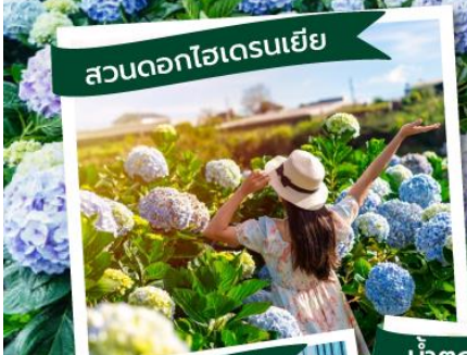
สวนดอกไฮเดรนเยีย