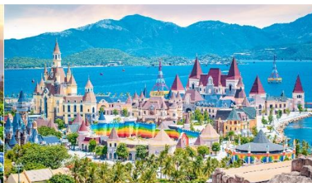
VinWonders NHA TRANG