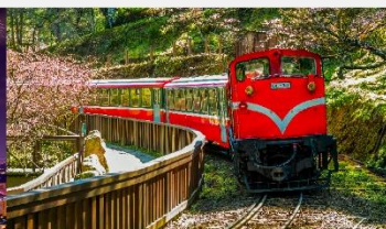
อุทยานแห่งชาติอาลีซาน