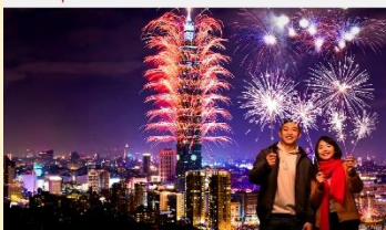
COUNTDOWN TO 2025