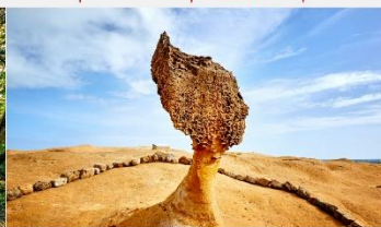
อุทยานธรณีเย่หลิว